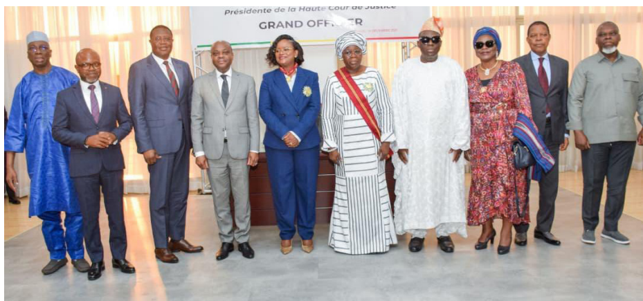
Élévation de la Présidente Dandi GNAMOU à la dignité de Grand Officier de l'Ordre national du Bénin — 15 décembre 2025