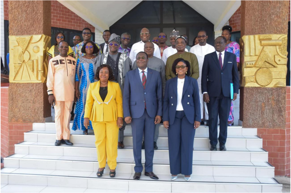
Séminaire sur la fonction juridictionnelle de la HCJ, Grand-Popo, octobre-novembre 2024