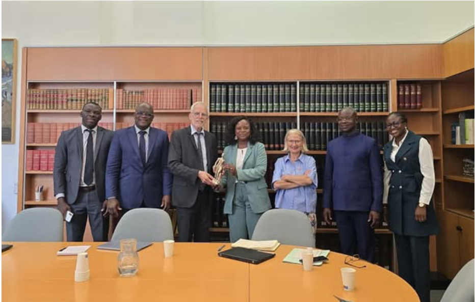
Mission d'étude à Paris (Cour de Justice de la République) — juin 2025

Ces missions comparatives ont permis à la Haute Cour de Justice d'enrichir sa réflexion sur les modalités concrètes de la mise en œuvre de la responsabilité des gouvernants, d'identifier des bonnes pratiques adaptables au contexte béninois et de nouer des relations de coopération durables avec des juridictions homologues.