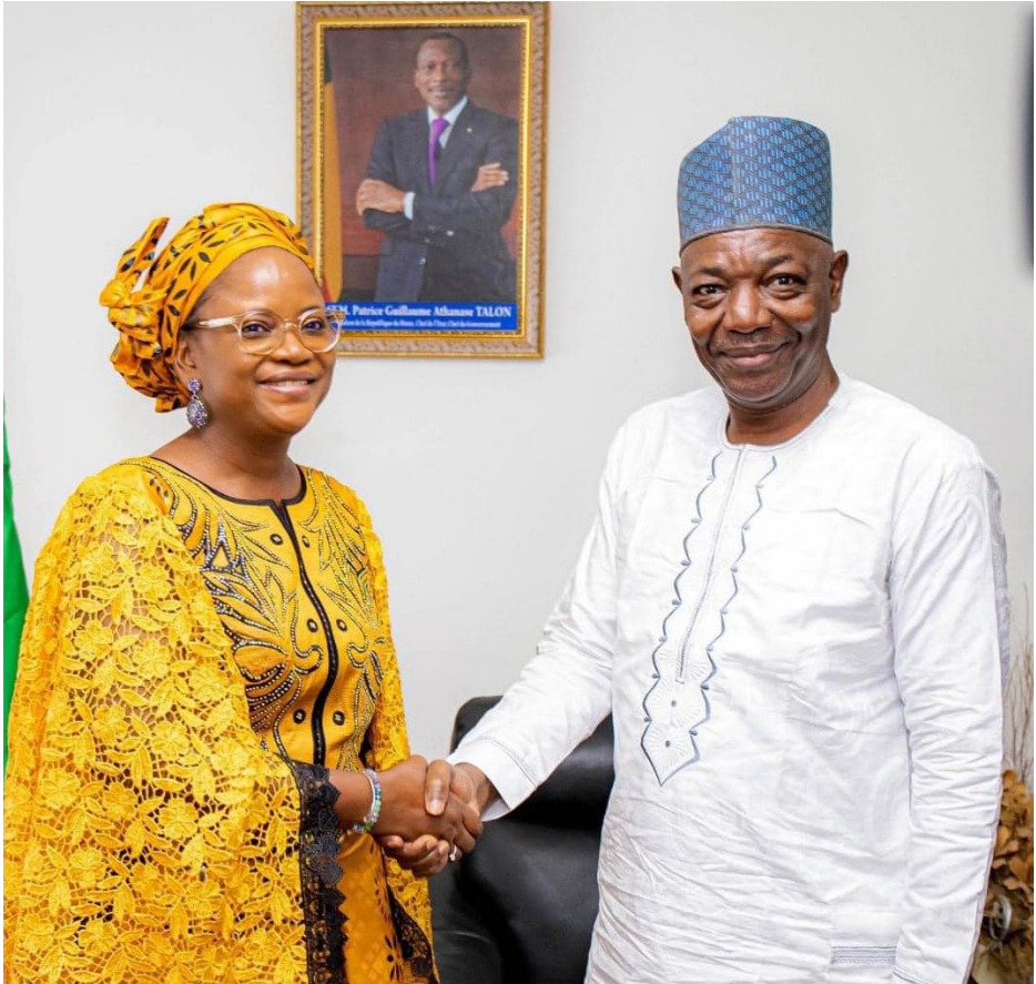
Visite au Président intérimaire du CES