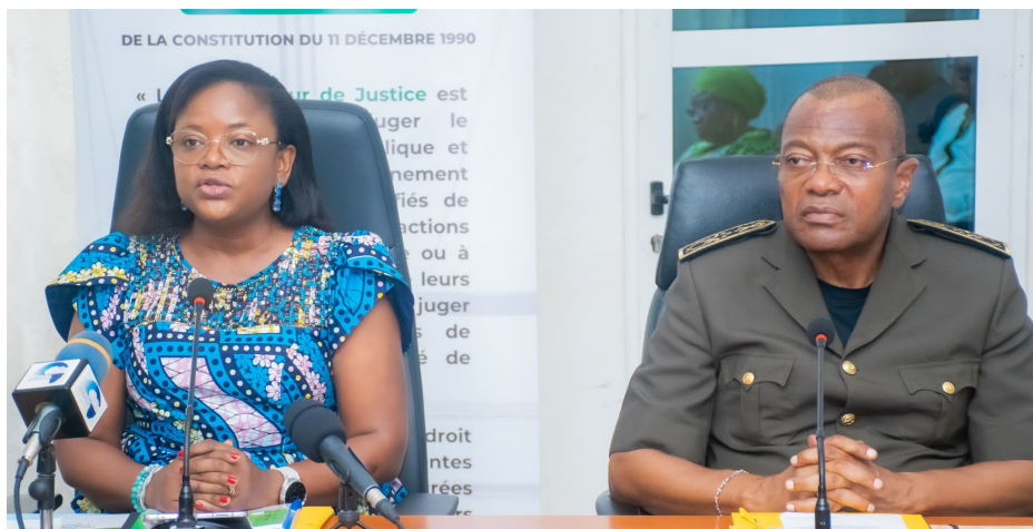
Tournée de sensibilisation sur la moralisation de la vie publique : Allada, juin-juillet 2025