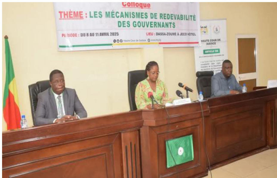
Colloque sur les mécanismes de redevabilité des gouvernants

la véritable colonne vertébrale sans laquelle toute idée de démocratie ne saurait valablement mûrir, prendre corps et se réaliser. 4