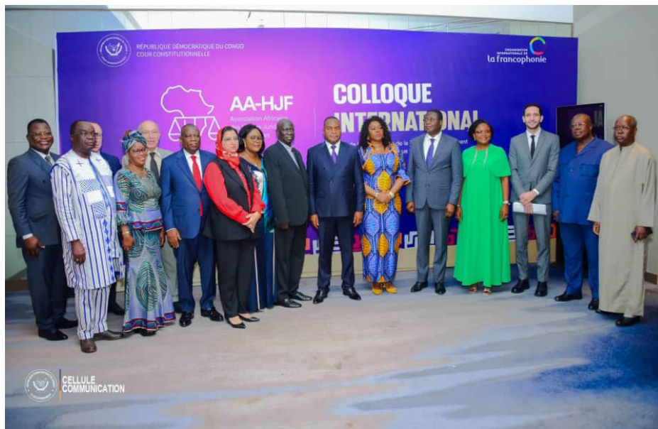
20es assises AA-HJF, décembre 2024