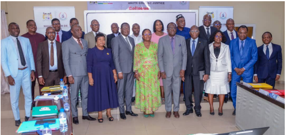
Session administrative — Dassa-Zoumé (avril 2025)

La session du 19 août 2025 à Ouidah, tenue à l'hôtel Casa del Papa, revêt une importance particulière. Elle a été consacrée à la question déterminante de la tenue des audiences relatives aux plaintes individuelles. Les débats, particulièrement riches et parfois intenses, ont opposé des positions juridiques solides sur la méthode à adopter et les procédures appropriées à mettre en œuvre. Les échanges ont porté notamment sur la nécessité de concilier le respect strict du cadre constitutionnel avec l'exigence, inhérente à toute juridiction, de dire le droit et d'éviter toute situation assimilable à un déni de justice.