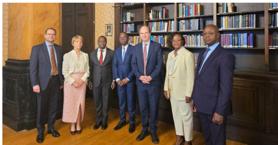
Mission d'étude en Belgique (Cour de cassation) — mai 2025