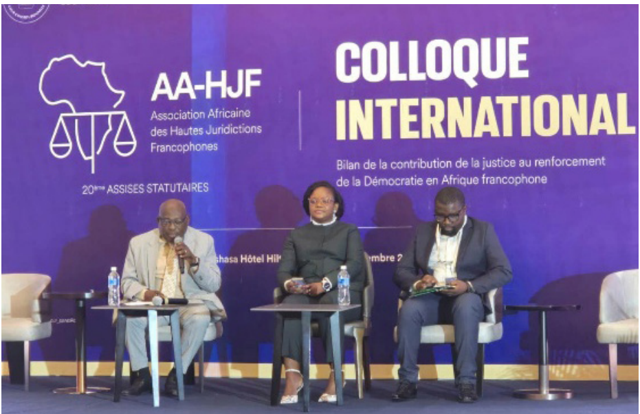
20es assises AA-HJF, décembre 2024