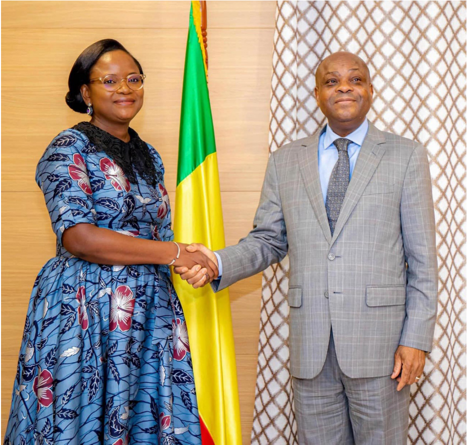
Visite au Président de la Cour Constitutionnelle