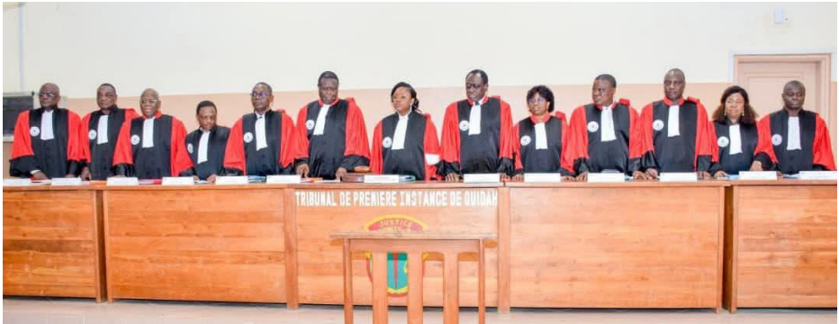
Audience juridictionnelle de simulation — Ouidah, 19-20 août 2025

est saisie, sans méconnaître le cadre constitutionnel et organique qui régit son fonctionnement.