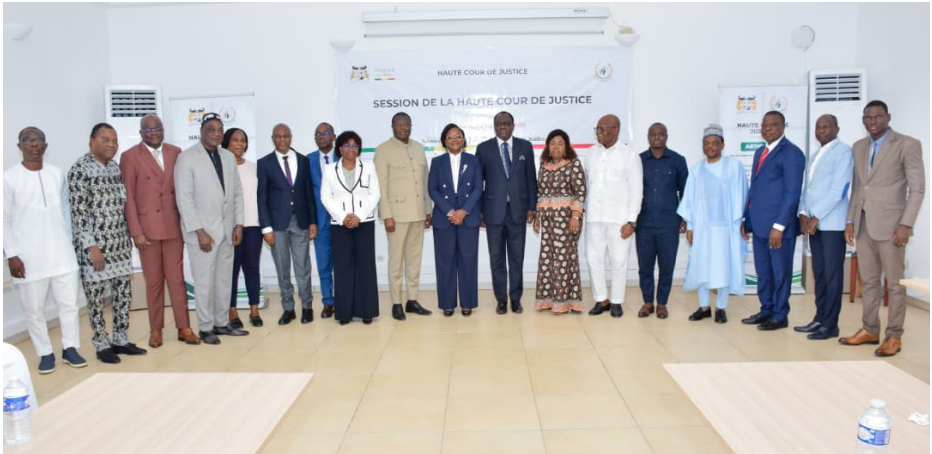
Session administrative du 19 août 2025, Ouidah

la volonté de conférer à chaque audience une solennité proportionnée à la gravité de la mission constitutionnelle de l'Institution.