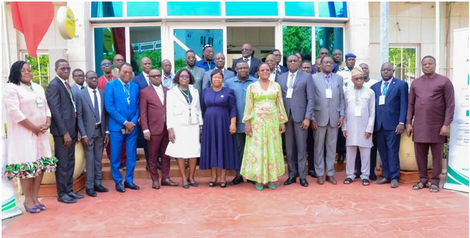
Dassa-Zoumé, avril 2025