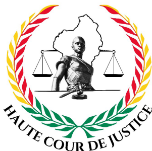
Nouveau logo de la Haute Cour de Justice

La session du 03 mai 2024 a notamment permis l'adoption d'un nouveau logo de la Haute Cour de Justice, intégrant la figure de l'Agodjié, symbole de courage et de protection, tenant le maillet de la justice et inscrite dans la carte du Bénin. Cette refonte de l'identité visuelle visait à renforcer la solennité, la lisibilité et l'autorité symbolique de la juridiction. La même session a acté l'adoption de règles de préséance des juges et le principe de l'acquisition de toges, afin de renforcer la solennité des audiences.