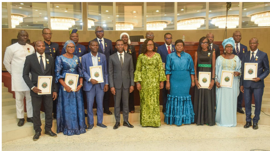
Cérémonie de remise de distinctions honorifiques — juin 2025

Le mardi 3 juin 2025, la Présidente de la Haute Cour de Justice a présidé la cérémonie de remise de distinctions honorifiques à dix-neuf (19) cadres du Ministère des Affaires étrangères et de la Coopération, saluant leur engagement exemplaire au service de la diplomatie béninoise et rappelant les valeurs cardinales du service public : rigueur, loyauté, discrétion et dévouement à l'intérêt général.