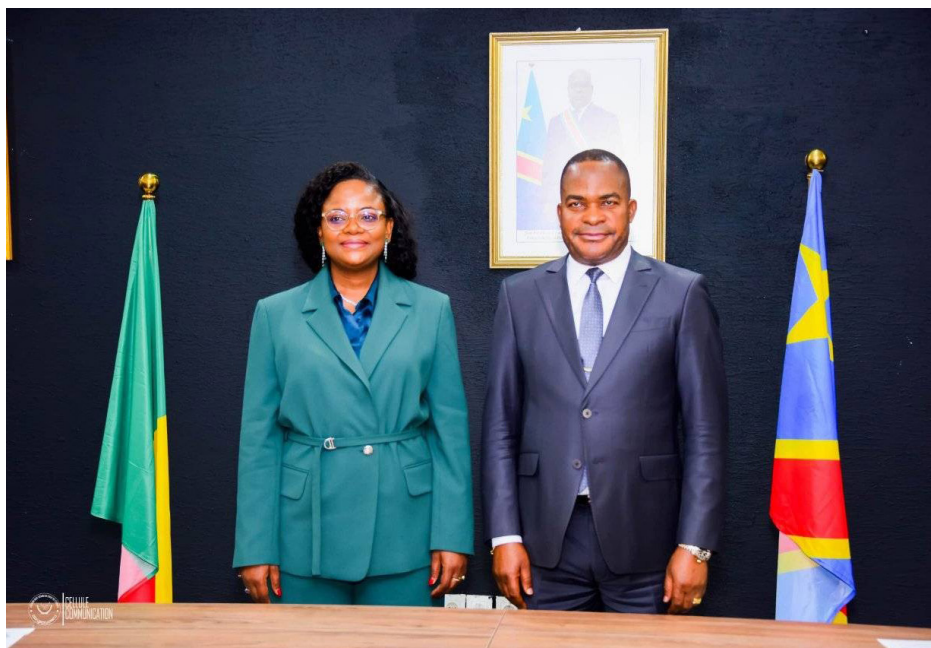
Visite d'échange avec la Cour constitutionnelle congolaise — Décembre 2024