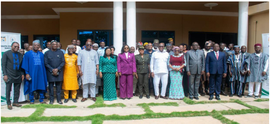
Tournée de sensibilisation sur la moralisation de la vie publique : Natitingou, juin-juillet 2025

Au-delà de sa portée pédagogique, cette action répond à un impératif stratégique : rassurer le citoyen sur le caractère opérant et effectif des mécanismes de redevabilité des gouvernants et sur la capacité de la Haute Cour de Justice à assumer pleinement sa fonction juridictionnelle. Elle participe ainsi à la construction d'une justice lisible, accessible et crédible, condition indispensable à l'acceptabilité et à l'effectivité de l'action juridictionnelle. Toutefois, la moralisation ne saurait constituer une fin en soi; elle appelle nécessairement sa traduction juridictionnelle.