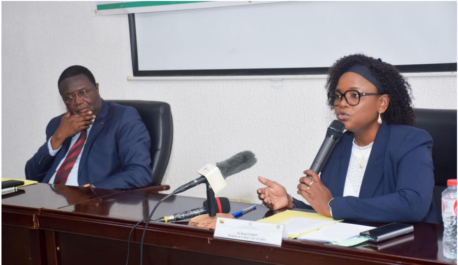
Séminaire sur la fonction juridictionnelle de la HCJ, Grand-Popo, octobre-novembre 2024