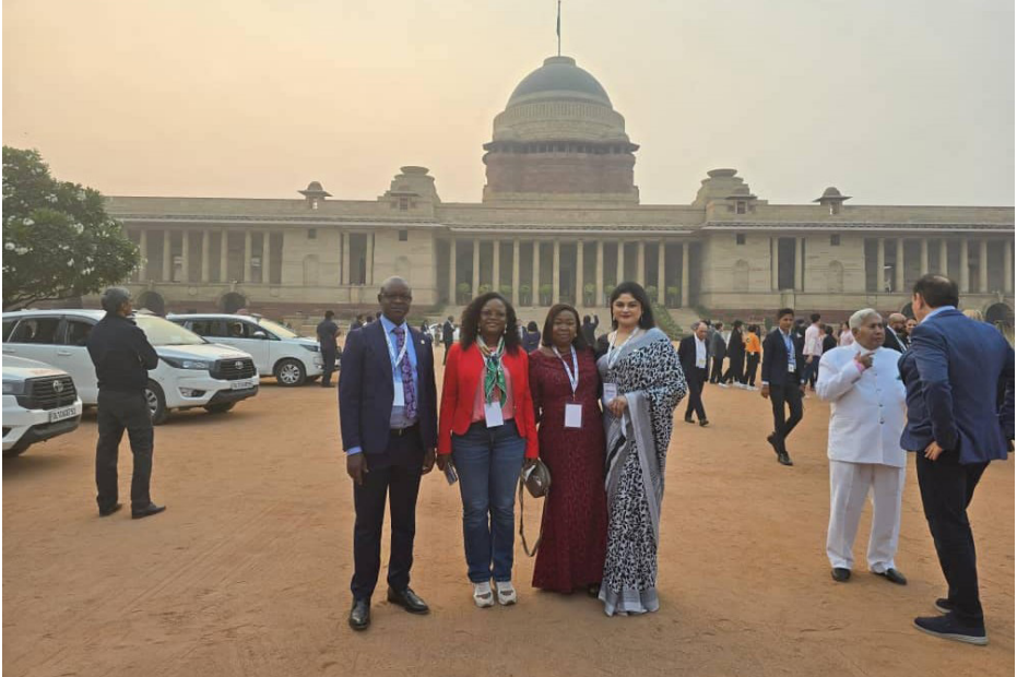
25e Conférence internationale des Chefs de juridictions