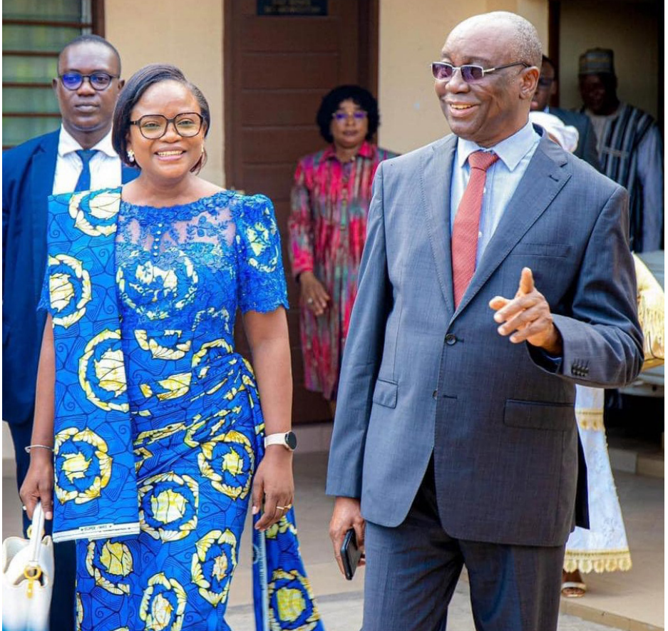
Visite au président de la CENA