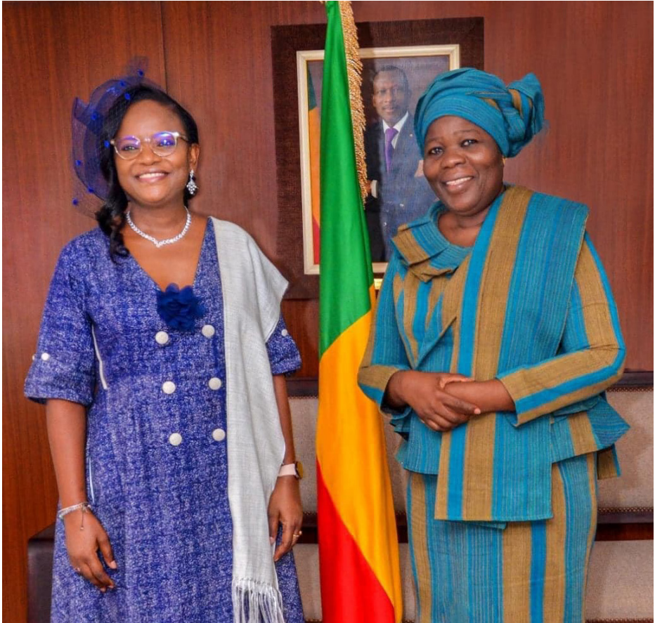
Visite à la Vice-Présidente de la République