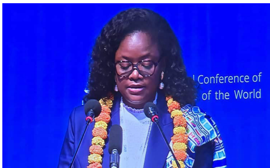
25e Conférence internationale des Chefs de juridictions — New Delhi & Lucknow (Inde), novembre 2024