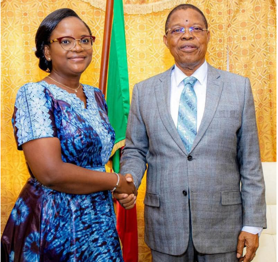
Visite au Médiateur de la République