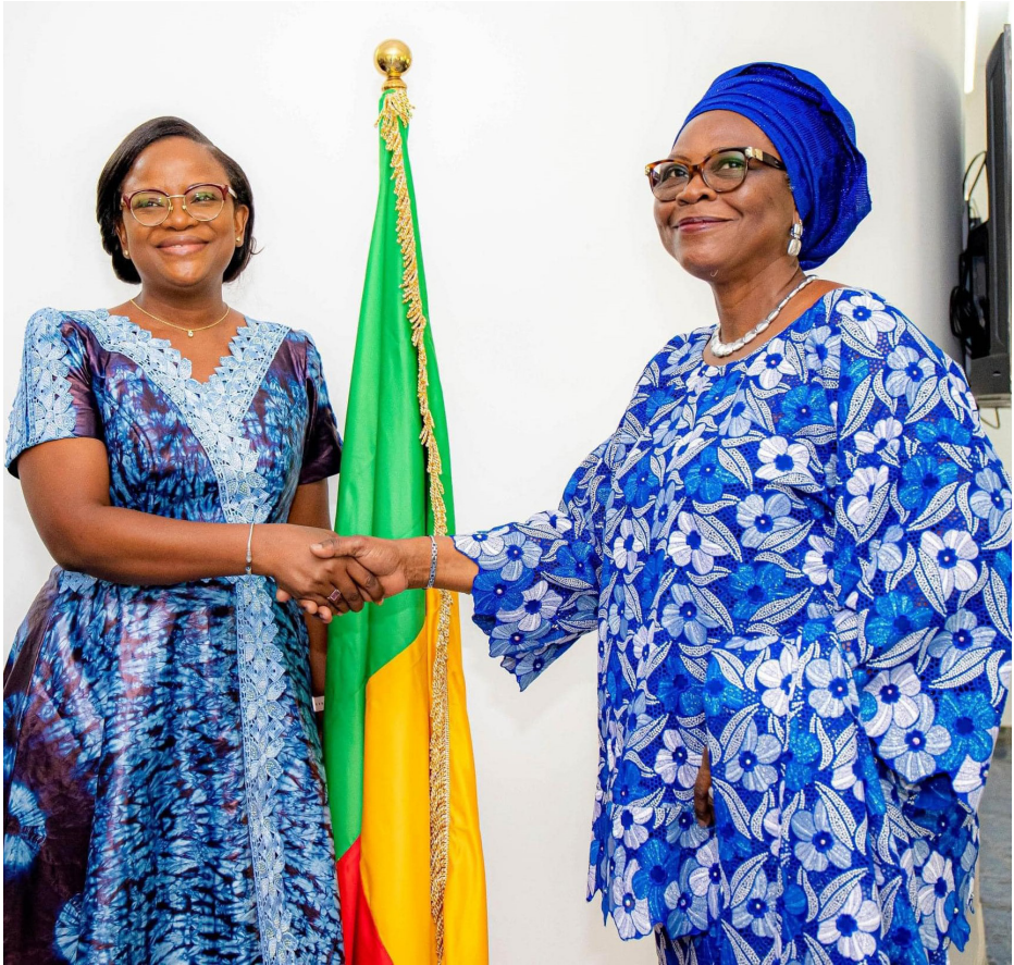
Visite à la Présidente de la Cour des Comptes