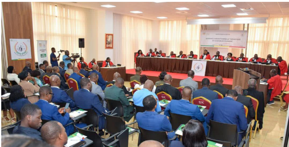
Audience juridictionnelle thématique — Cotonou, 22 septembre 2025