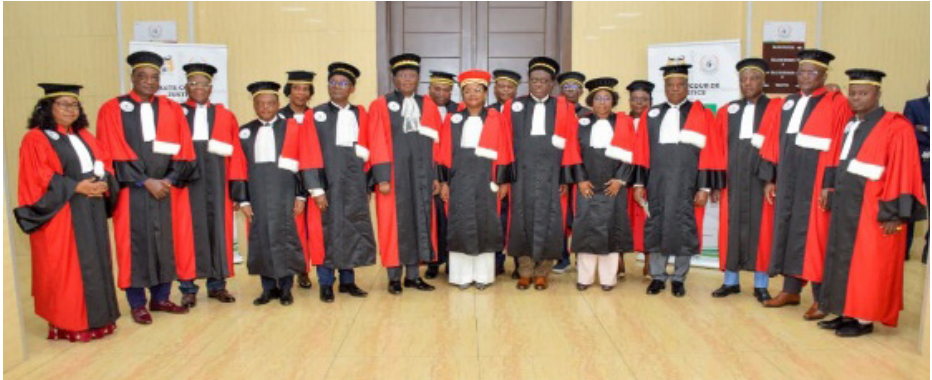
Assemblée plénière de la Haute Cour de Justice — 23 septembre 2025

Vingt-quatre ans après sa mise en service, la Haute Cour de Justice s'est réunie pour la première fois en Assemblée plénière, marquant une étape décisive dans le processus d'exercice progressif et maîtrisé de sa fonction juridictionnelle. Convoquée par la Présidente suivant l'ordonnance n° 2025-076/HCJ/PT/DC/SG/SA, l'Assemblée plénière s'est tenue le 23 septembre 2025 au siège provisoire de la Cour à Cotonou.