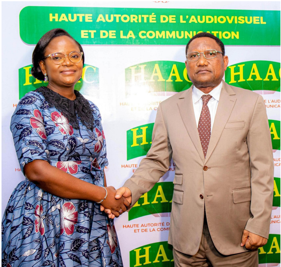
Visite au Président de la HAAC