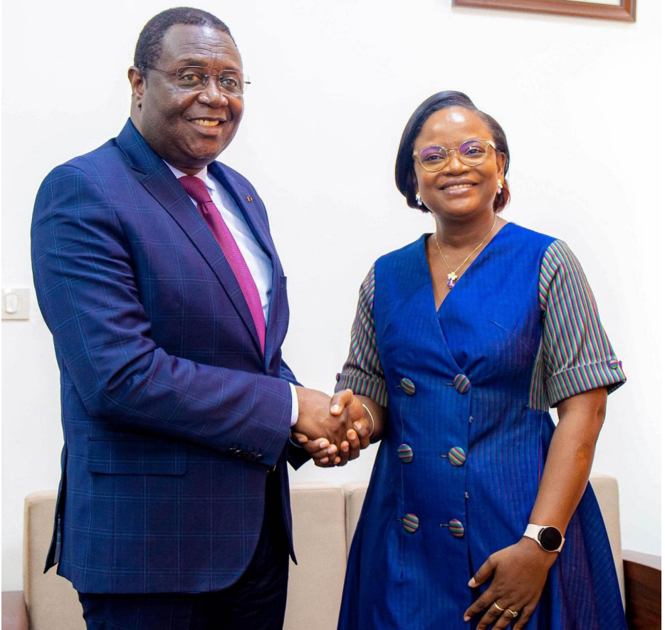
Visite au Président de la Cour Suprême