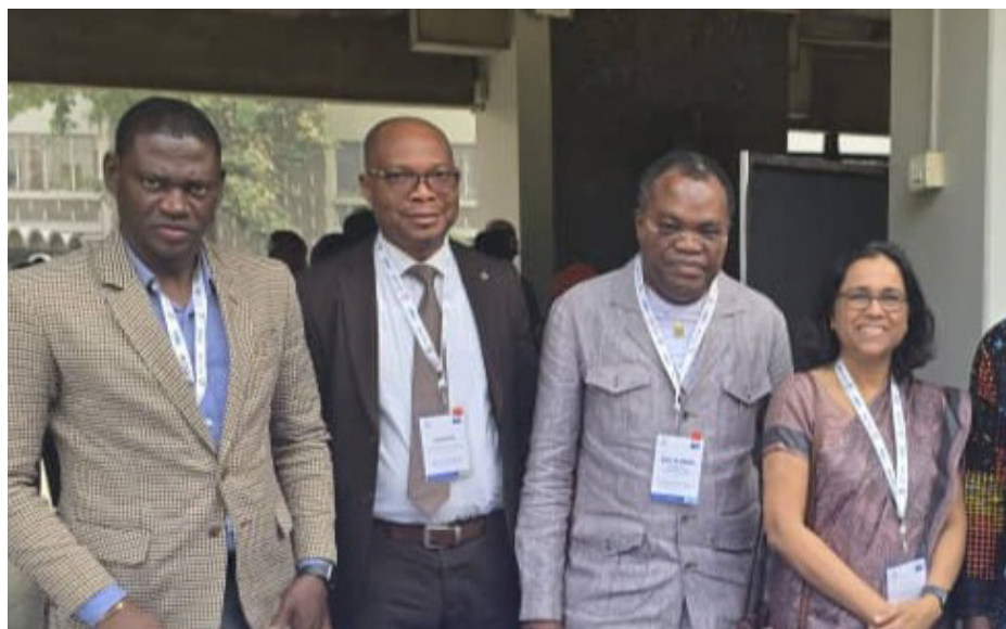
26e Conférence internationale des Chefs de juridictions — Inde, novembre 2025