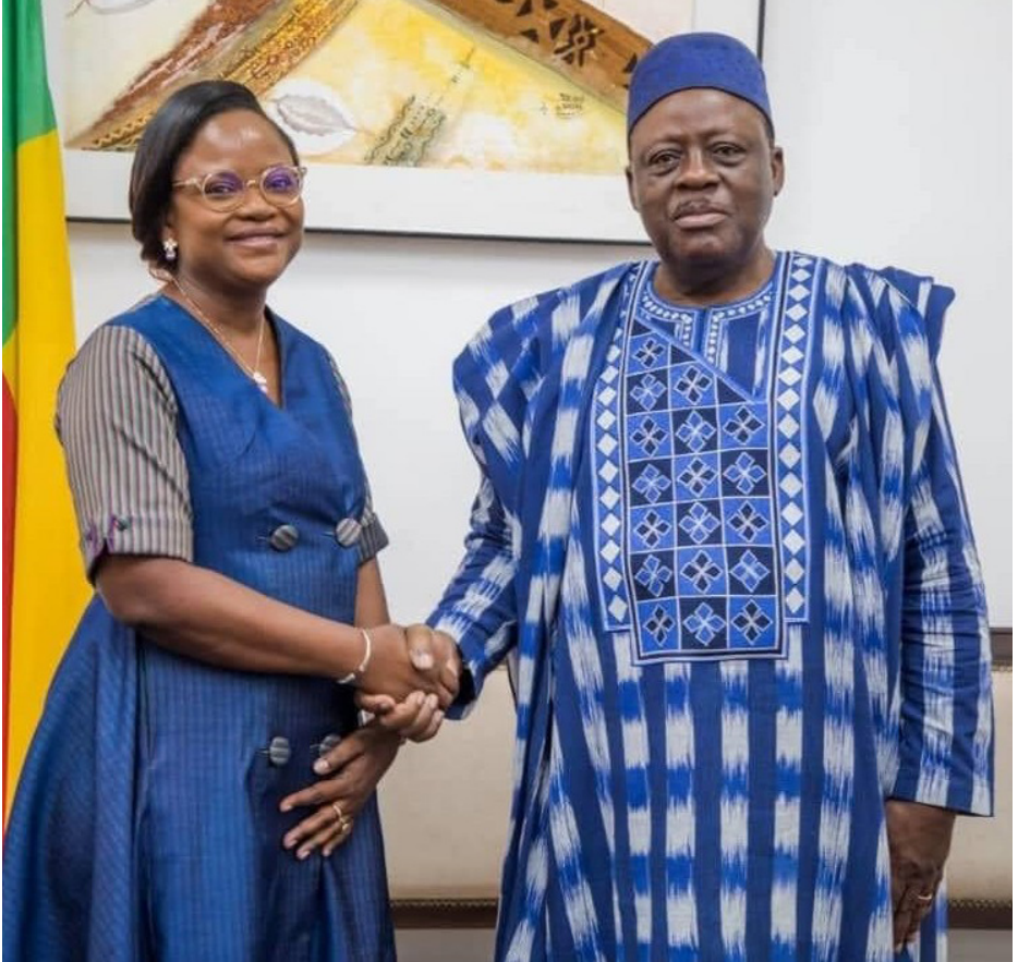
Visite au Président de l'Assemblée Nationale